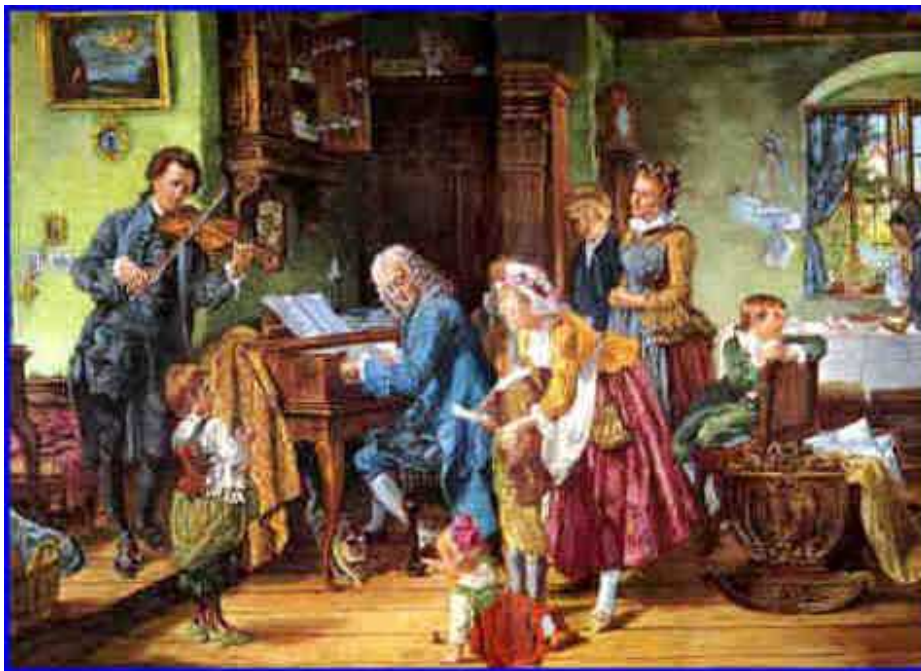
"Douceurs domestiques chez les Bach" http://michele-gabriel.chez-alice.fr/pge77-14.html

Il est le 3ème enfant d'Anna-Magdalena et de J.S. Au service de la Cour à Bückeburg durant toute sa vie, il poursuivit la tradition familiale ; stable au milieu d'une époque bouillonnante, un peu à l'ombre de Carl Philipp Emmanuel.