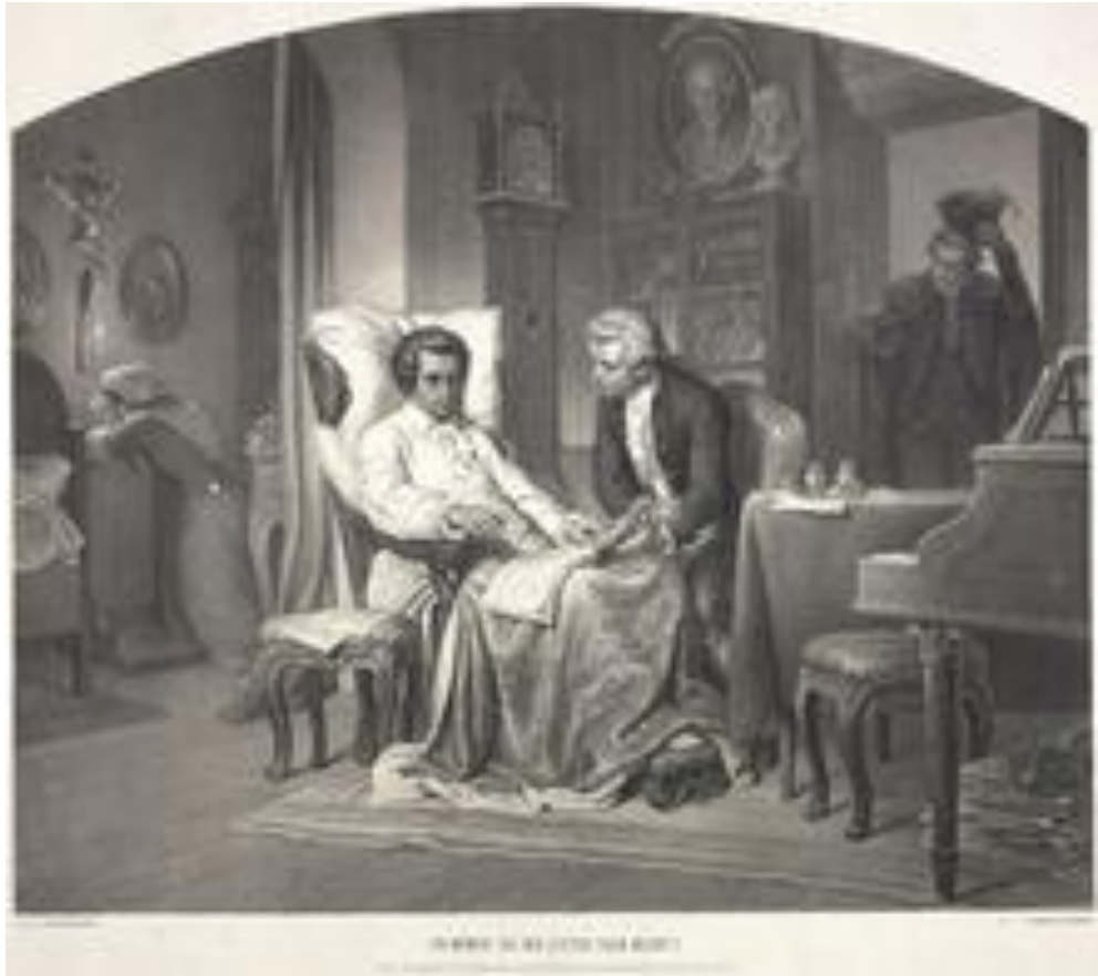
Derniers jours de Mozart, lithographie de Friedrich Leybold de 1857